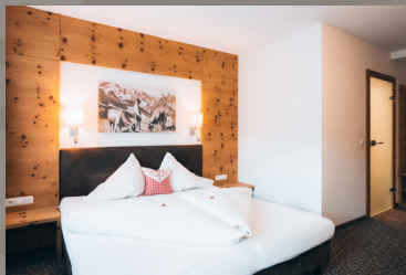
Familien- & Doppelzimmer „Tirol“ 19-31 m 2 / 18-22 m 2 Doppel- & Familienzimmer mit Verbindungstüre als 4-Bett-Zimmer für 2E+2K, Dusche Handtuchtrockner, WC, TV, Haarfön, Telefon, Balkon