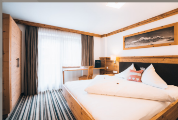
Gasthof Doppelzimmer „Brandstadt“ 23 m 2 Doppelzimmer, WC, Handtuchtrockner, TV, Haarfön, Telefon, große Terrasse