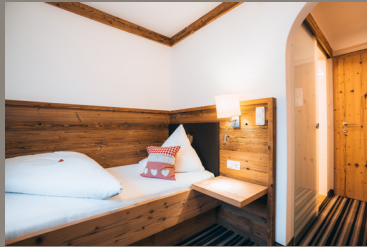
Einbettzimmer „Tirol“ 15 m 2 Einzelzimmer inkl. Dusche, WC, Handtuchtrockner, TV, Haarfön, Telefon